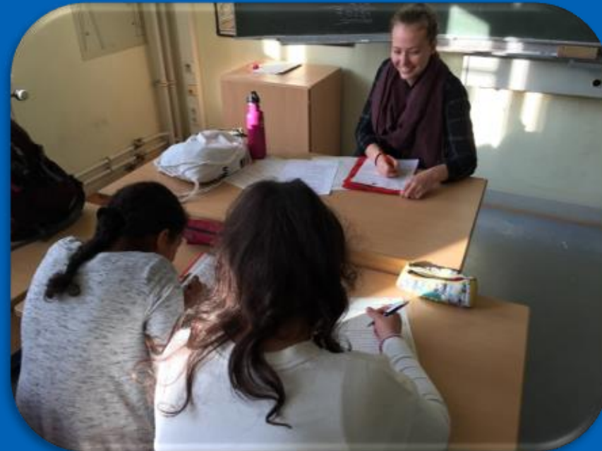
Förderkurse in den Fächern Deutsch, Englisch, Mathematik und Latein (L1)