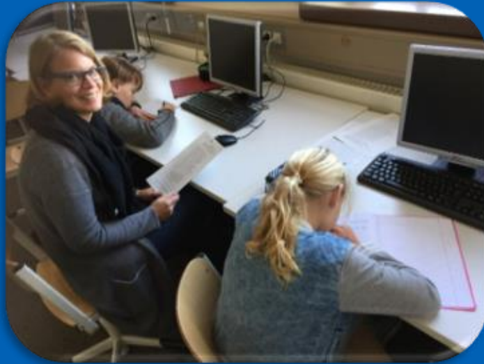
Förderung bei LRS